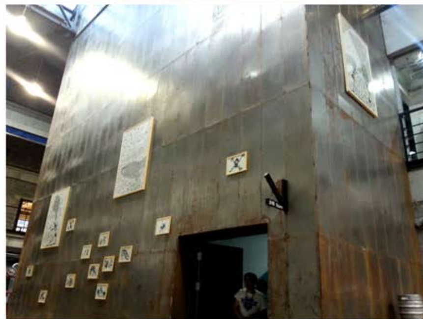
Danse macabre , Encre, craies et impressions linogravure sur papier, Installation pour We are here , 28.07-31.08.2014 Space 1905, Shenyang, Chine