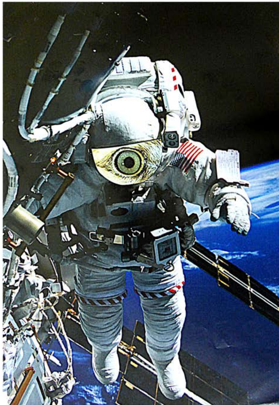
Ce qu'est la nature, collage, 21 x 29,7 cm, 2017