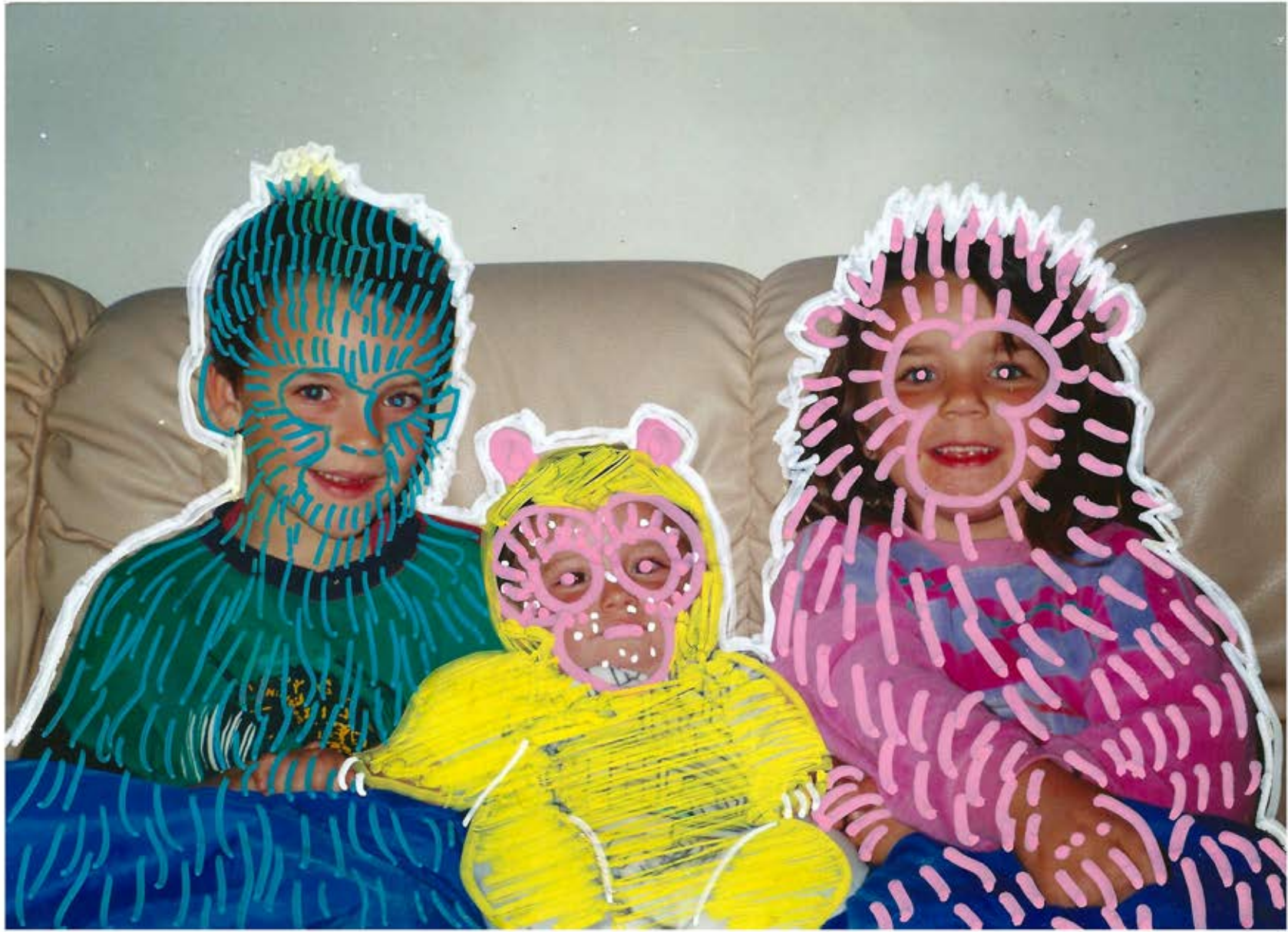
Observation de la faune sauvage: le petit d'homme, acrylique sur photographie, 15 x 21,5 cm, 2016