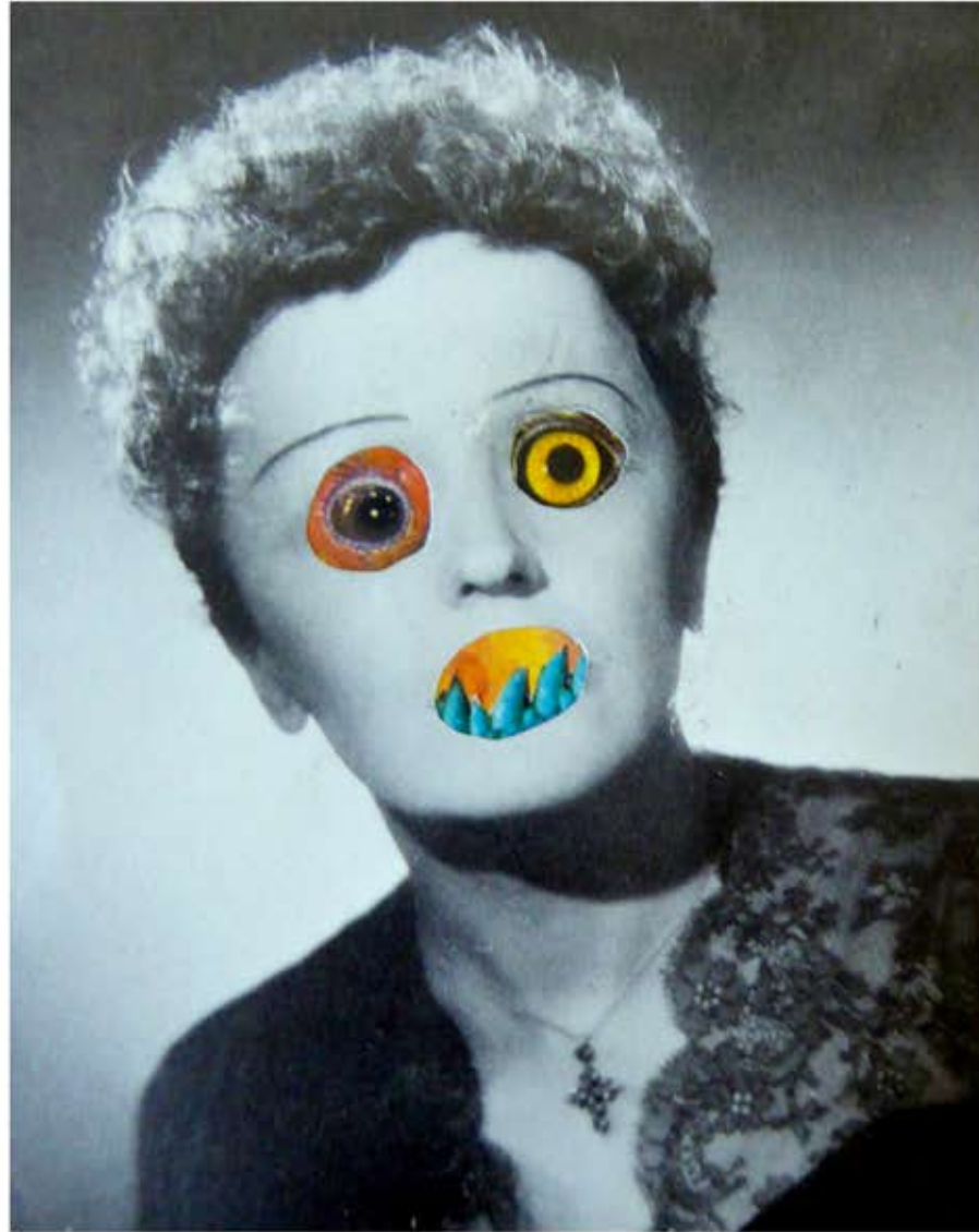
Head it, collage, 8,5 x 15 cm, 2017