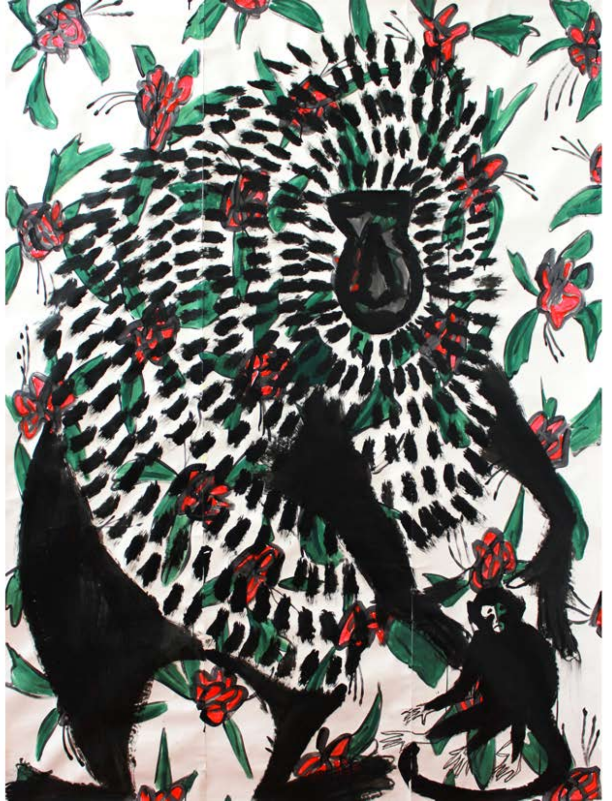
Fibre stimulante, Acrylique sur papier, 200 x 250 cm, 2012