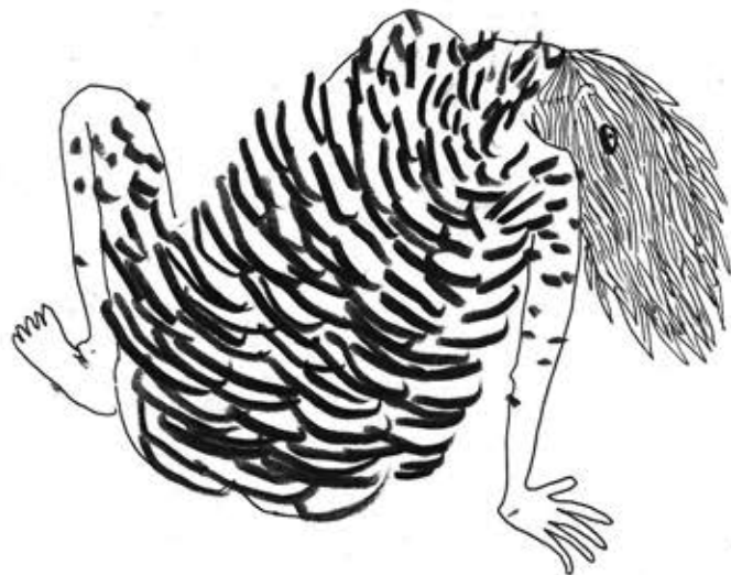
Métamorphose, techniques mixtes sur papier, 27,5 x 35,5 cm Sauvage! La Ligne, Saint-Denis, 09.09-21.10.2014