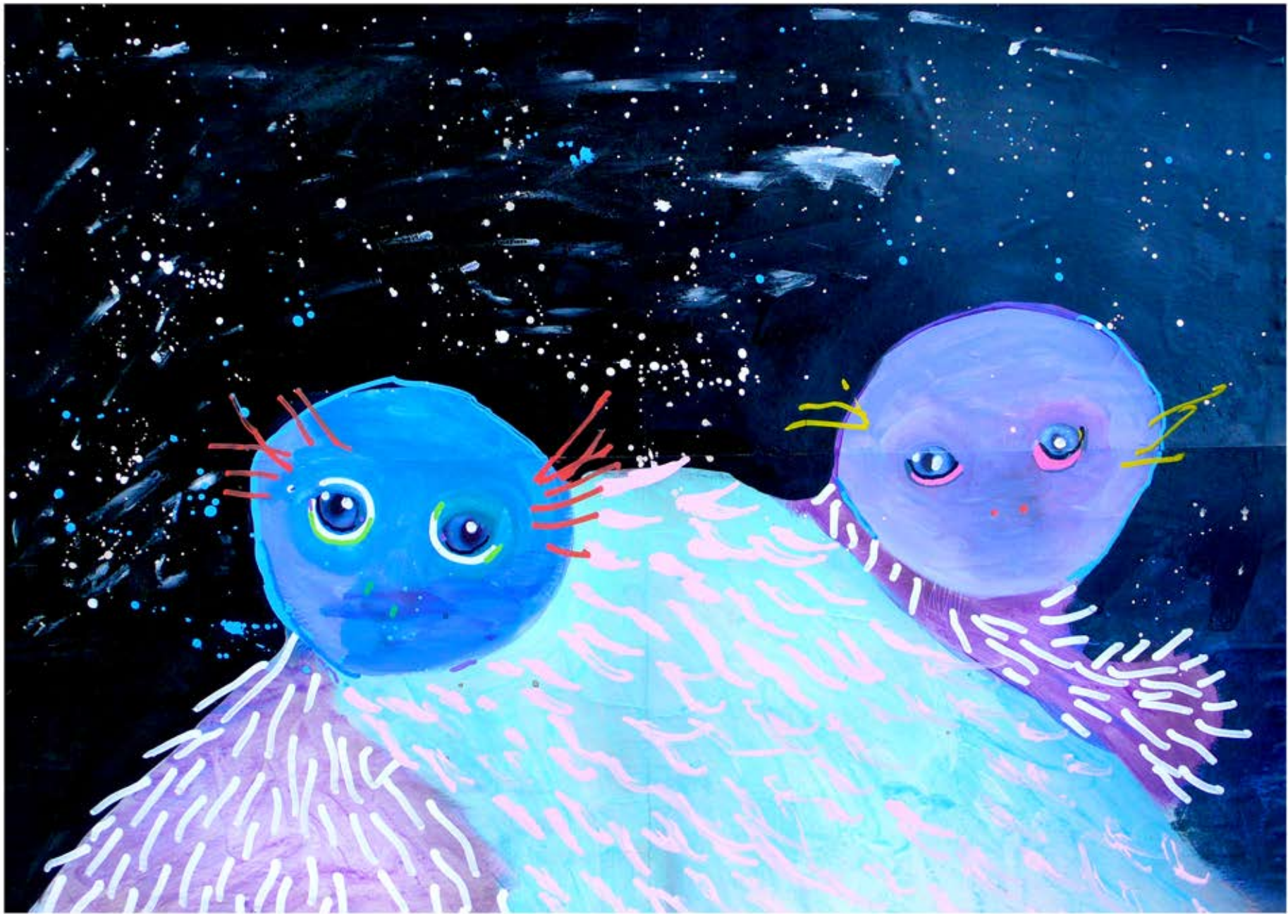
Masques jumeaux acrylique, collage sur papier, 40 x 55 cm, 2019