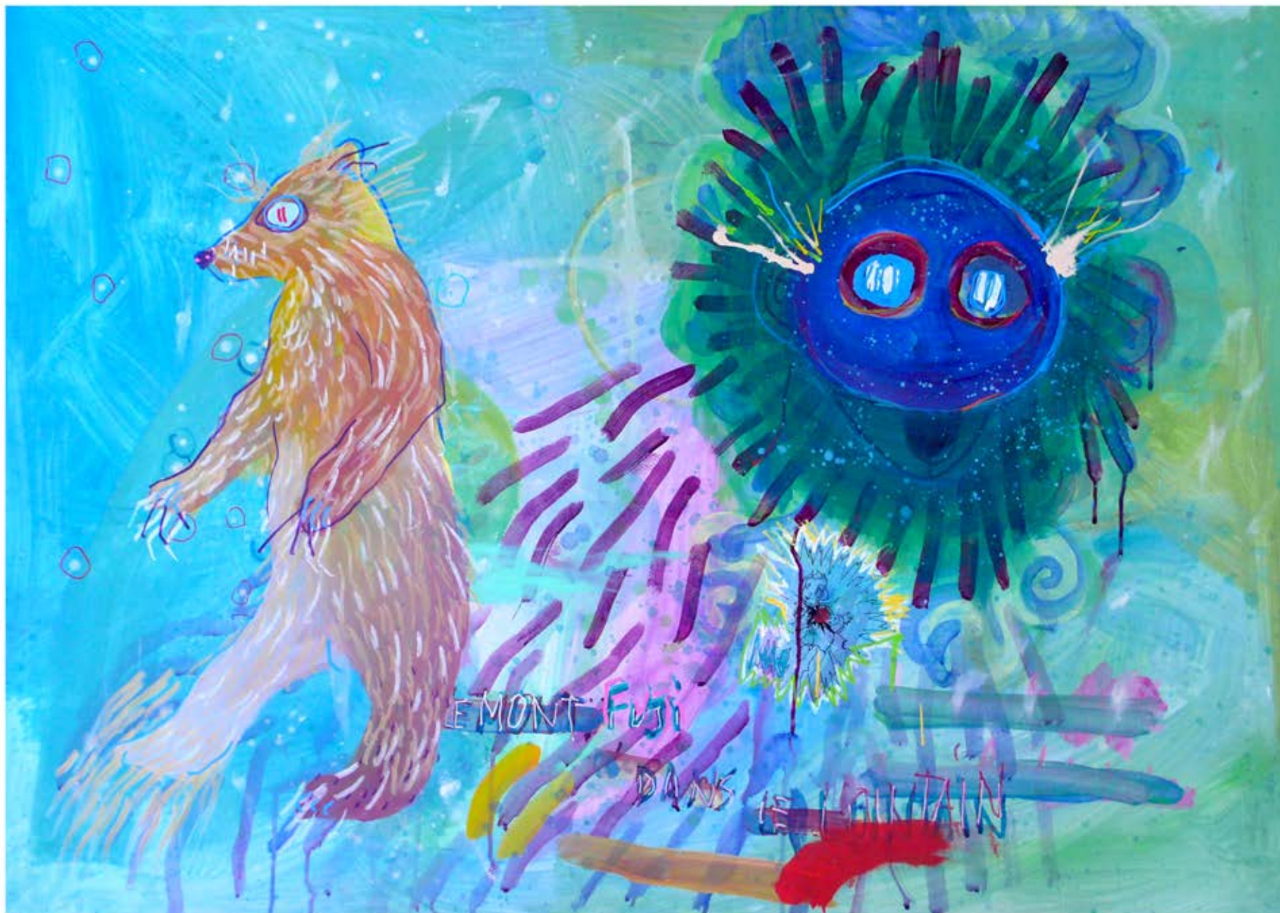
Le mont Fuji dans le lointain, acrylique, encre, crayons de couleur sur papier, 100 x 130 cm, 2019