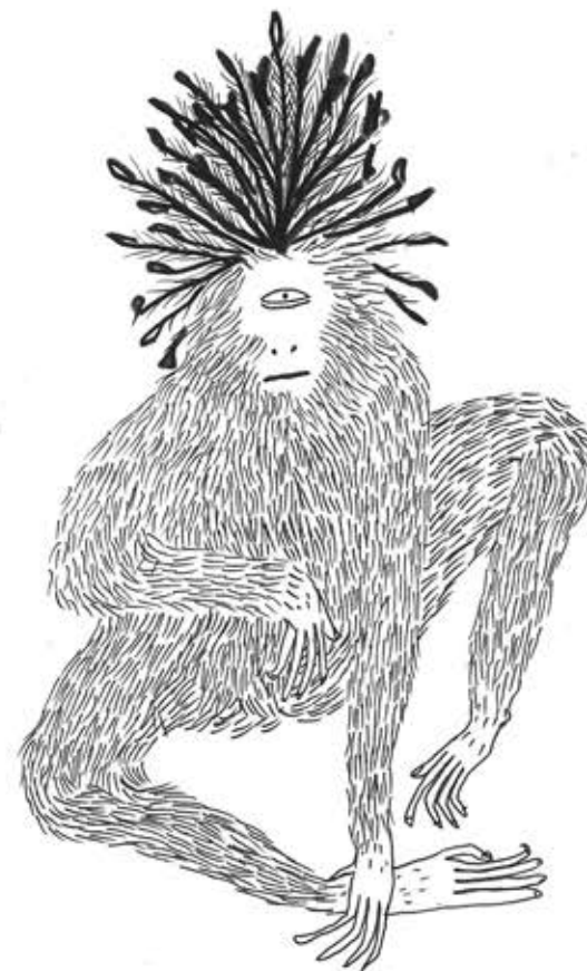
Majesté, techniques mixtes sur papier, 27,5 x 35,5 cm, Sauvage! La Ligne, Saint-Denis, 09.09-21.10.2014