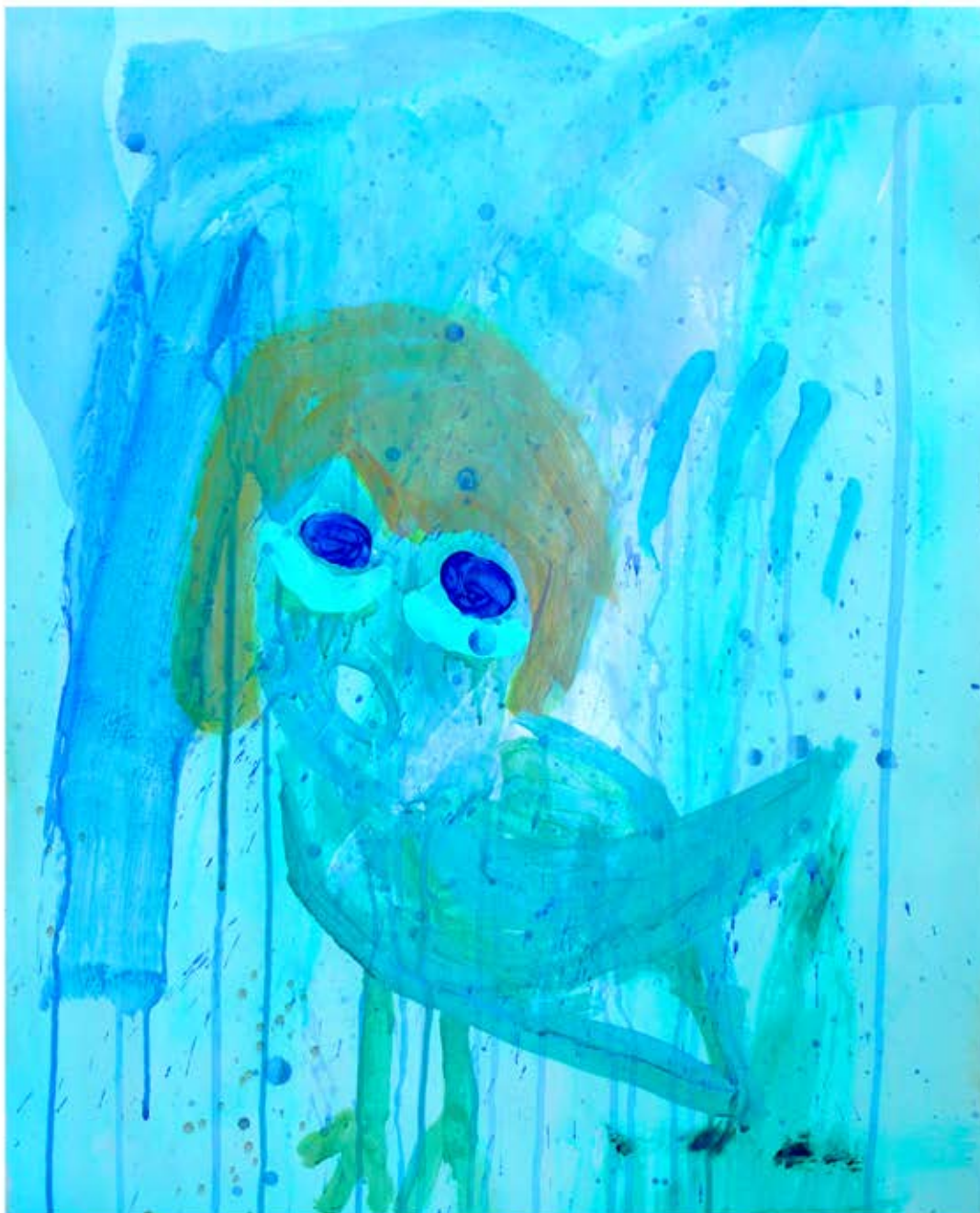
Oiseau grimé, acrylique sur papier, 50 x 65 cm, 2019