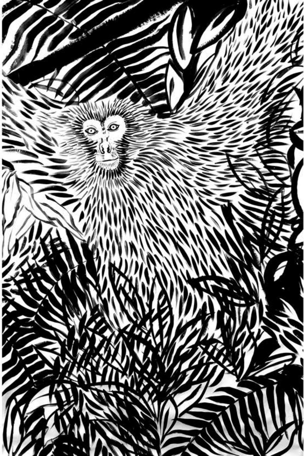
Glissement, Acrylique sur papier, 120 x 180 cm, 2012