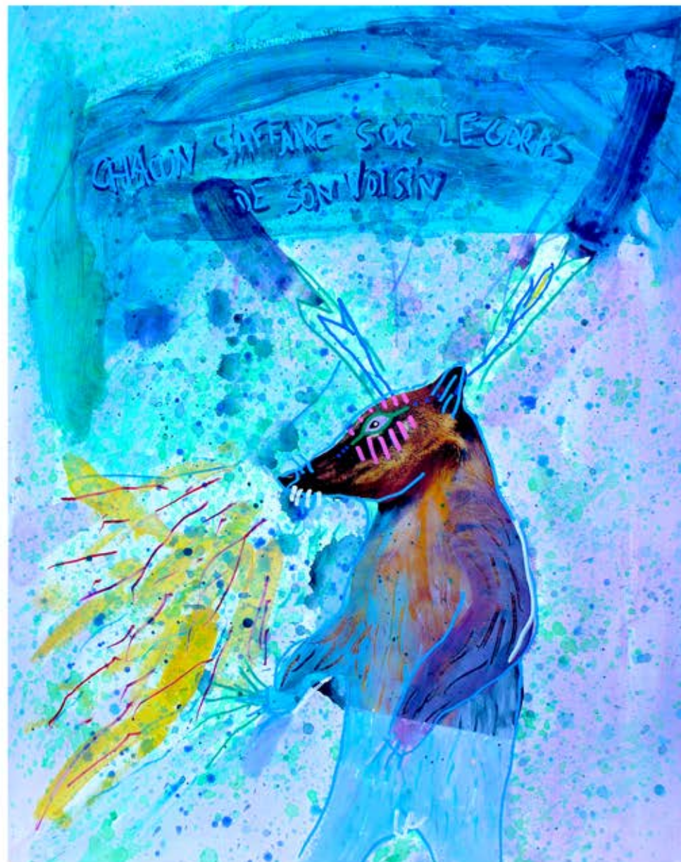
Chacun s'affaire sur le corps de son voisin acrylique, collage sur papier, 50 x 65 cm, 2019