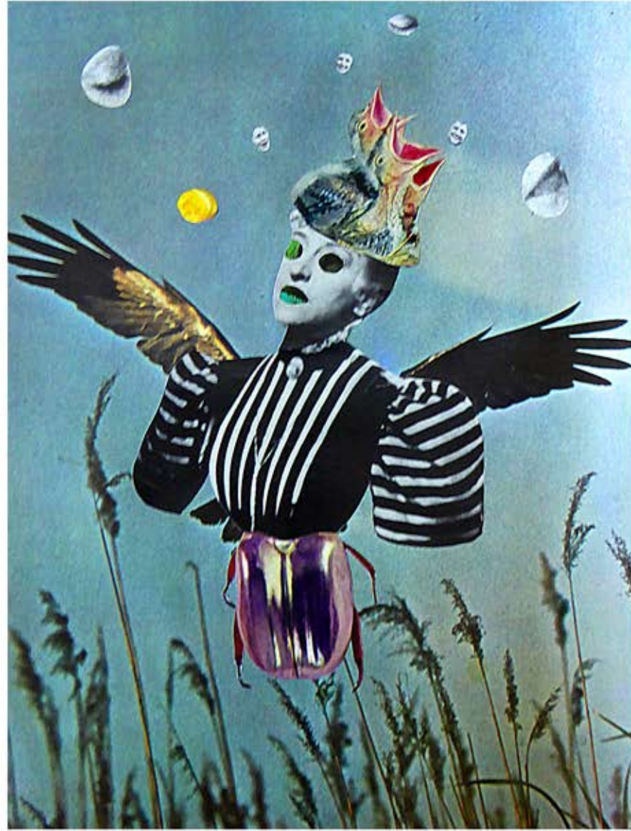
Cupidité, Ingratitue, Egoïsme, collage, 21 x 29,7 cm, 2017