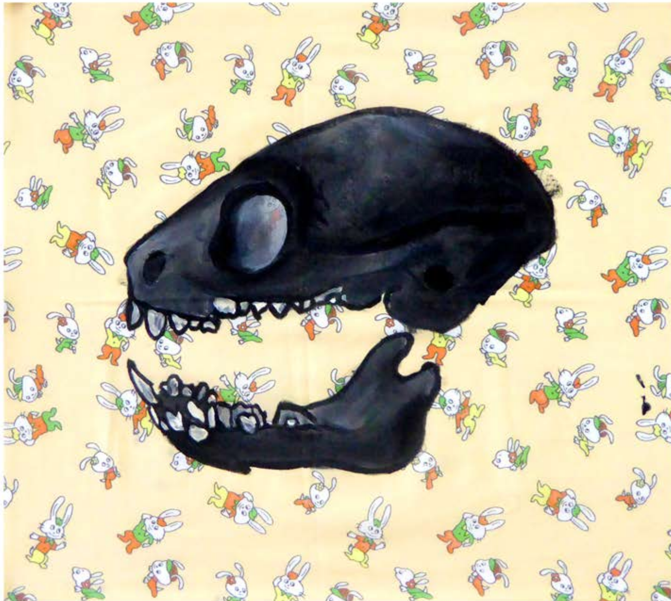
Bunny acrylique sur taie d'oreiller, 45 x 45 cm, 2018