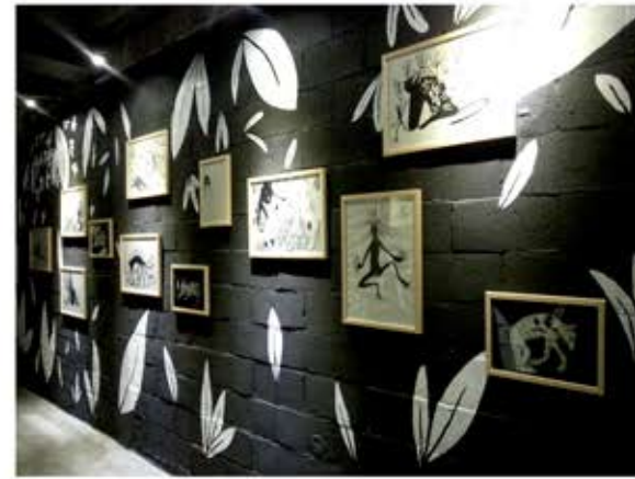
Enfant sauvage , peinture murale et techniques mixtes sur papier, Installation pour We are here , 28.07-31.08.2014 Space 1905, Shenyang, Chine