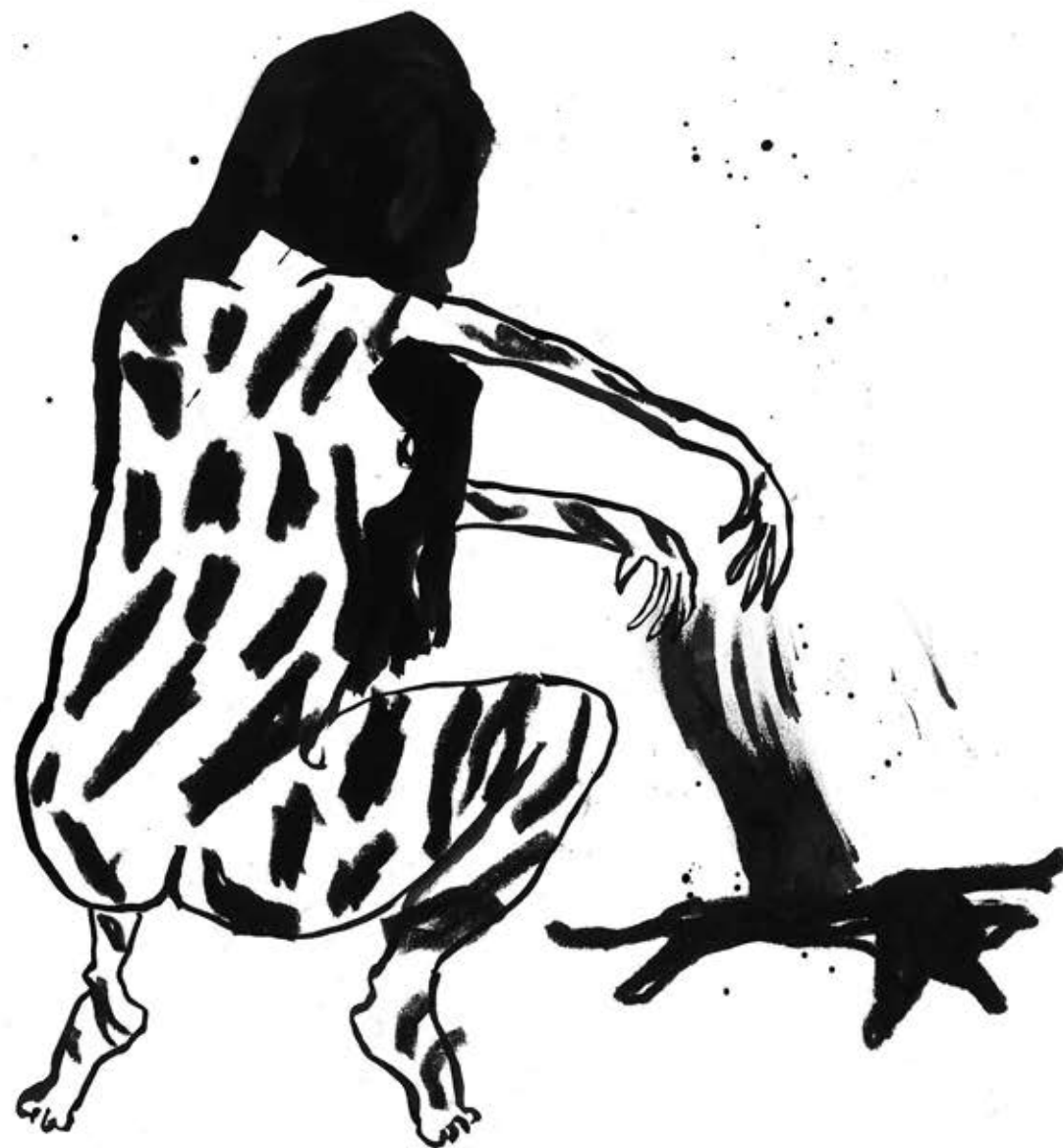
Sabbat techniques mixtes sur papier, 27,5 x 35,5 cm Sauvage! La Ligne, Saint-Denis, 09.09-21.10.2014