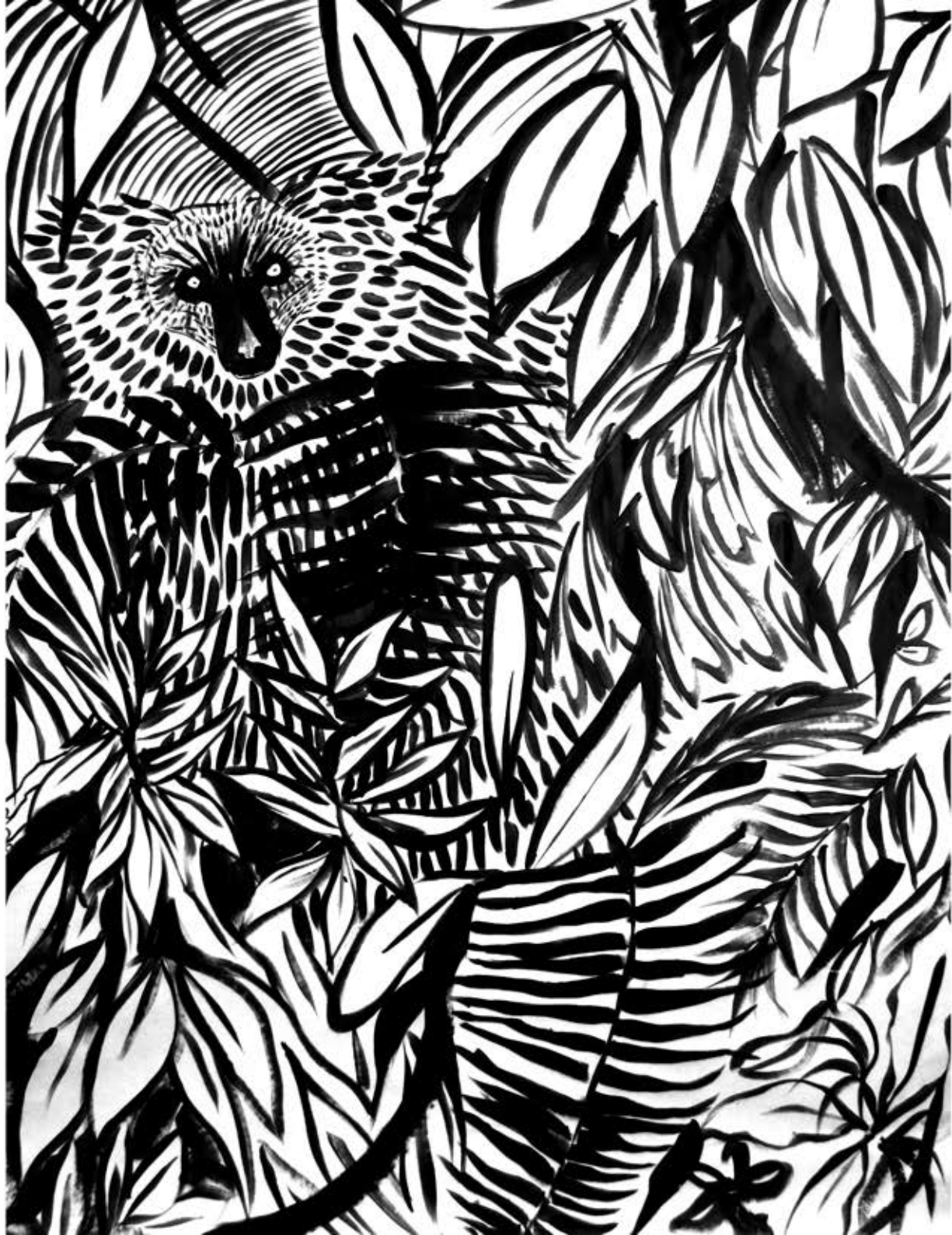
Lémure Acrylique sur papier, 120 x 150 cm, 2012