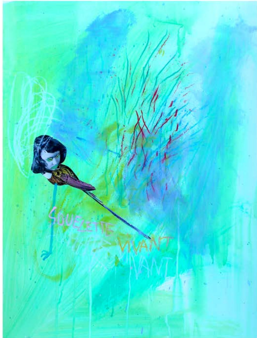
Squelette vivant acrylique, collage sur papier, 50 x 65 cm, 2019