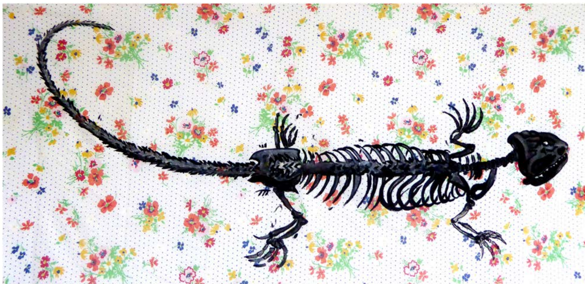
Caméléon sur nappe acrylique sur nappe, 60 x 150 cm, 2018