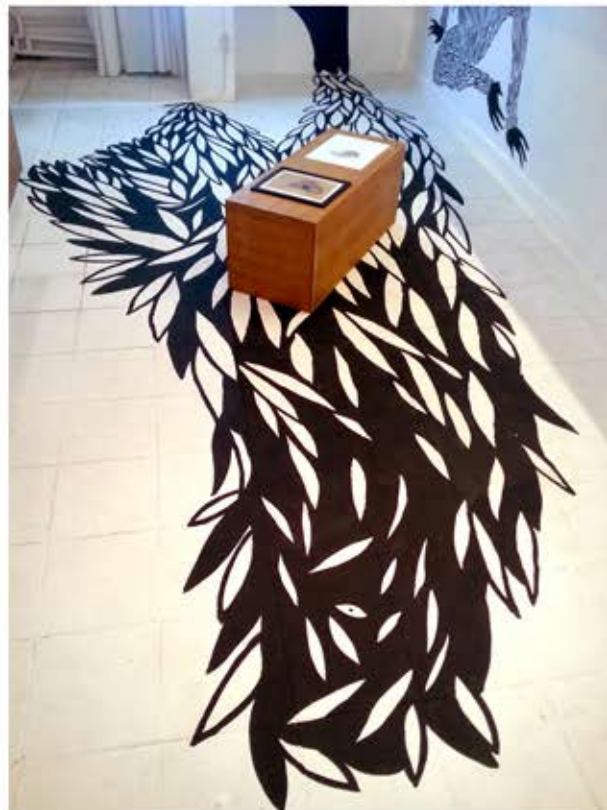
Sauvage! Installation de dessins et peintures murales, La Ligne, Saint-Denis 09.09-21.10.2014