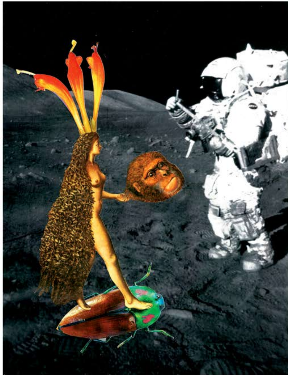
Welcome, collage, 21 x 29,7 cm, 2016