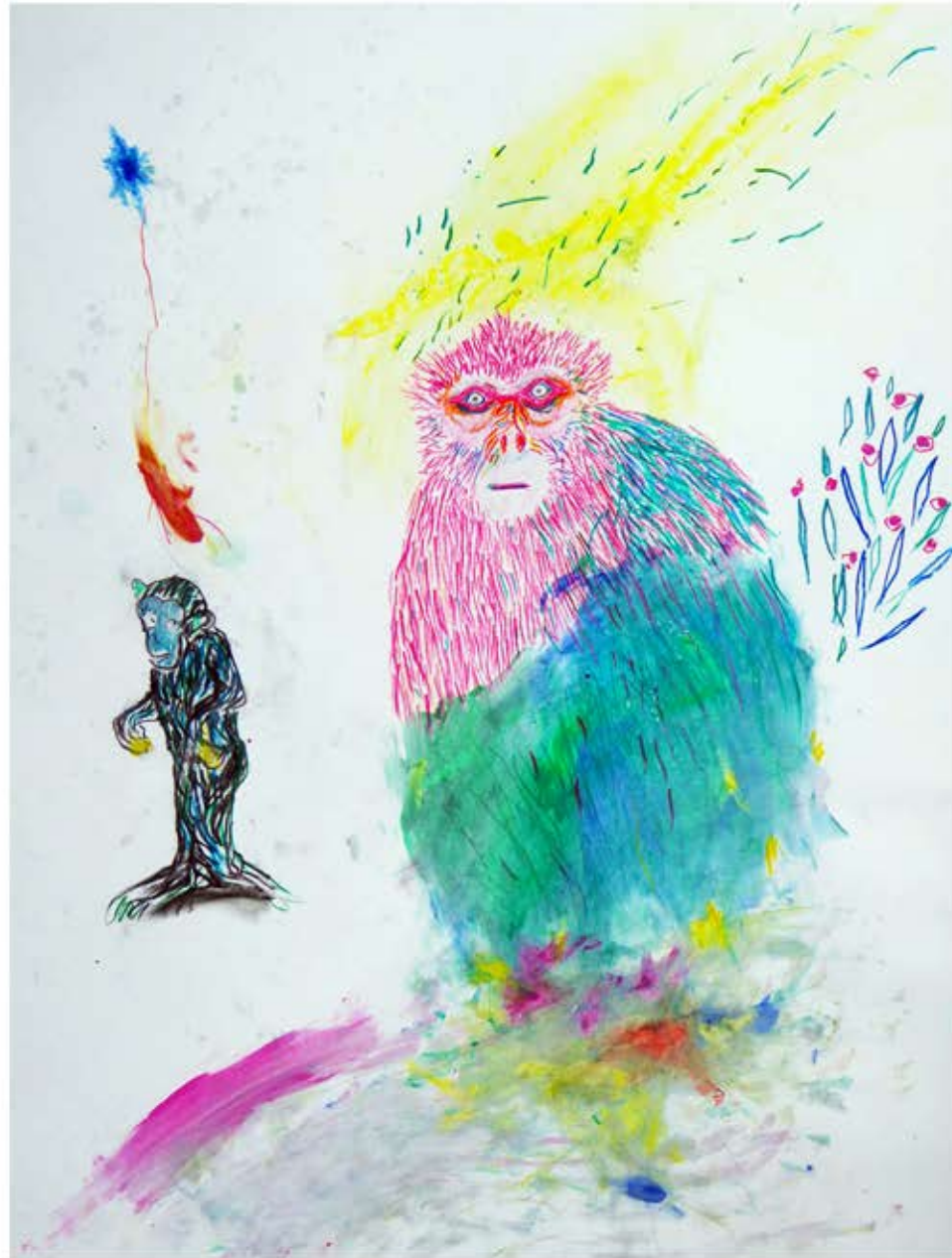
Human out,, acrylique et crayon de couleur sur papier, 61 x 80 cm, 2015