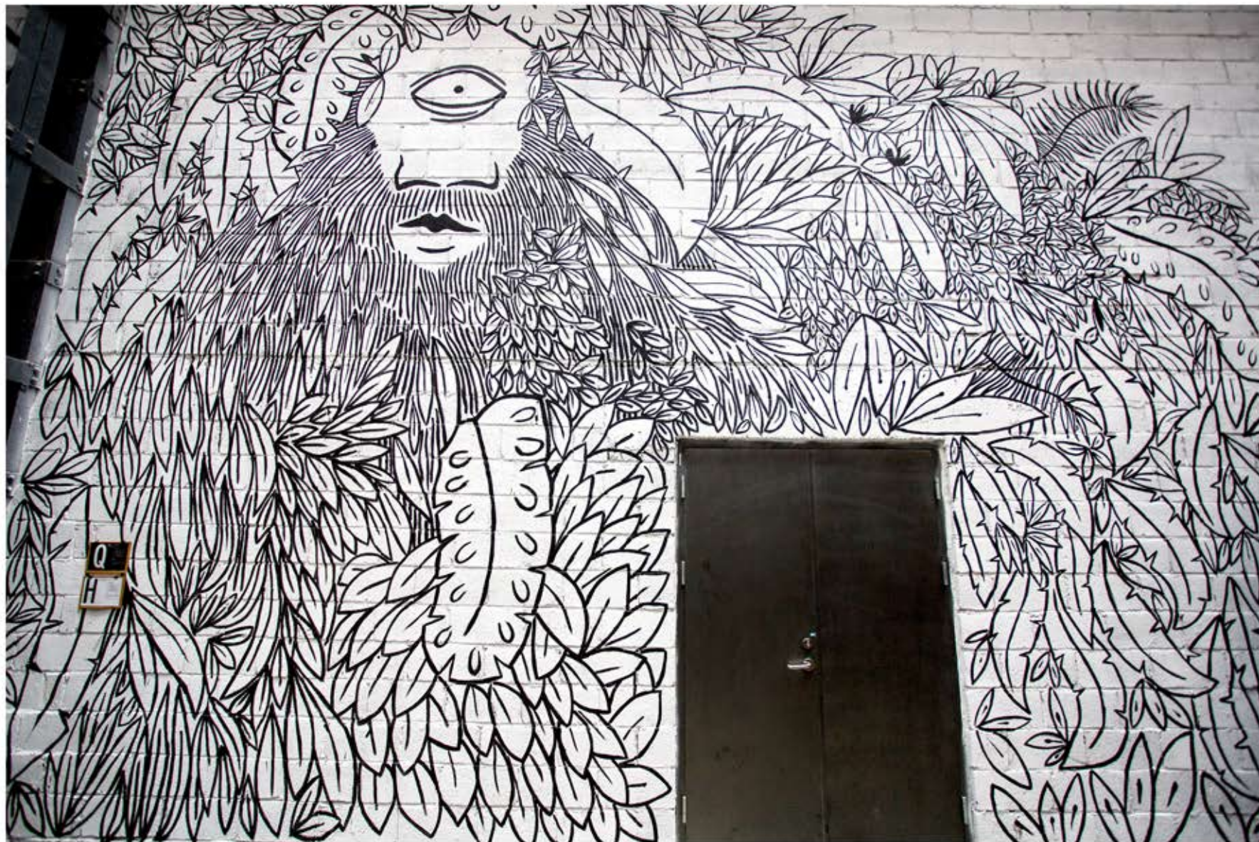
Cyclope, peinture murale, 20 x 15 m, We are here, 28.07-31.08.2014 Space 1905, Shenyang, Chine