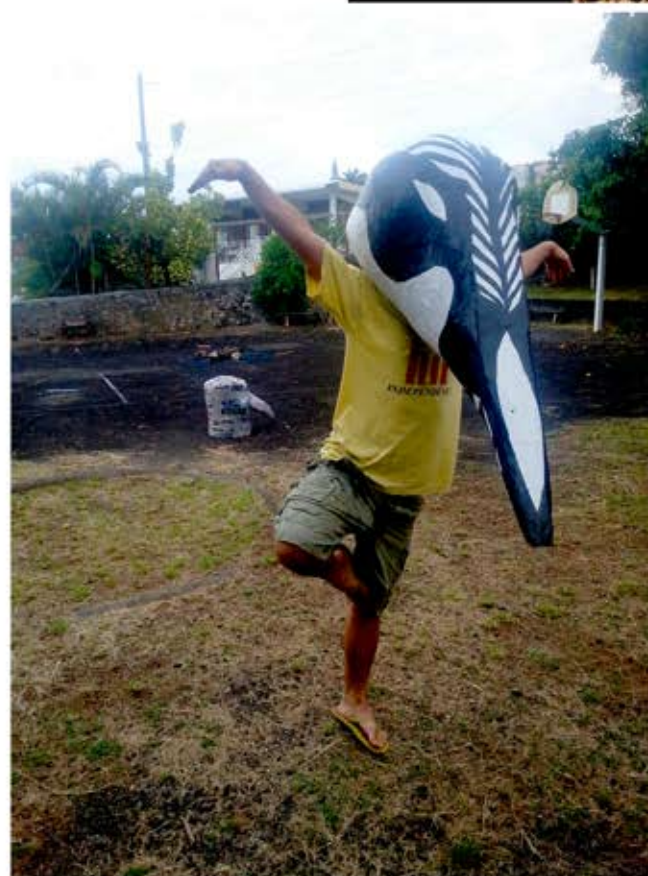
Bébête daa caz , performance masquée Toutes aux balcons, en collaboration avec Constellation, Saint-Denis, Réunion, 2014