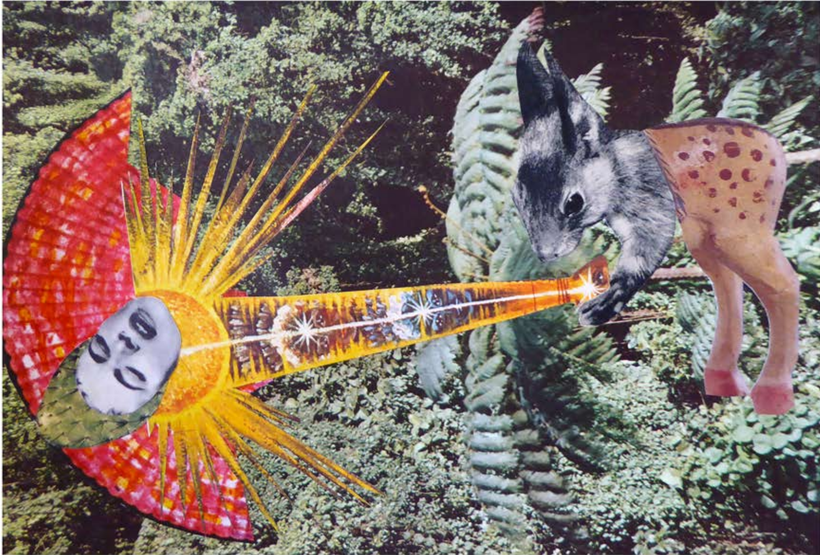
Je prendrai soin de toi Incha'Allah, collage, 21 x 29,7 cm, 2017