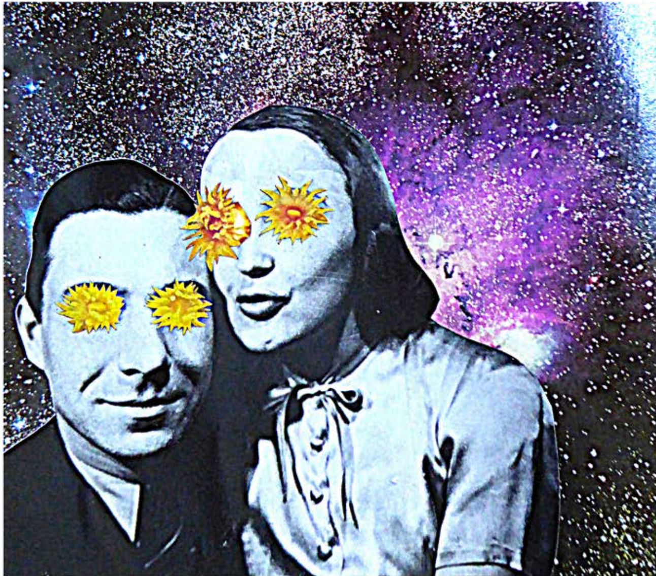
Splendide! collage, 17 x 23 cm, 2017